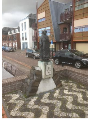
Foto Maak bij dit beeldje een selfie van je waarbij je zo mooi mogelijk in het Oranje bent verkleed. De mooiste verklede persoon ontvangt een prijs.

Route als je tussen de containers bent doorgelopen en je loop door kom je bij een beeld van Koningin Wilhelmina.